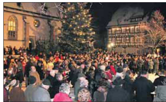
Altjahrbendfeier in Eltingen startet um 18 Uhr