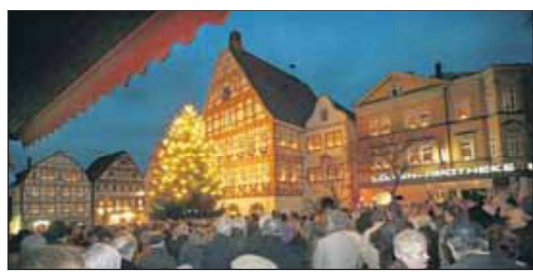
Altjahrbendfeier auf dem Leonberger Marktplatz, 31. Dezember, 17 Uhr